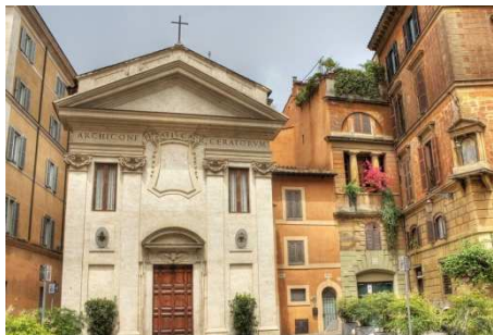
San Giovanni della Pigna