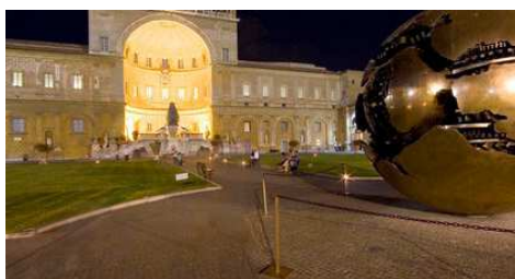
La Cappella Sistina

Cosa c'è di più solenne, magnifico, spirituale, emozionante, estasiante della Cappella Sistina?! Un viaggio splendido in compagnia di una guida ufficiale ed esperta, attraverso tutte le ricchezze qui custodite e che, passo dopo passo, dipinto dopo dipinto, ci condurrà sino al capolavoro assoluto di Michelangelo Buonarroti: la sacra Cappella Sistina.