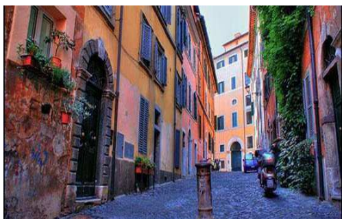
Basilica di Santa Maria Maggiore