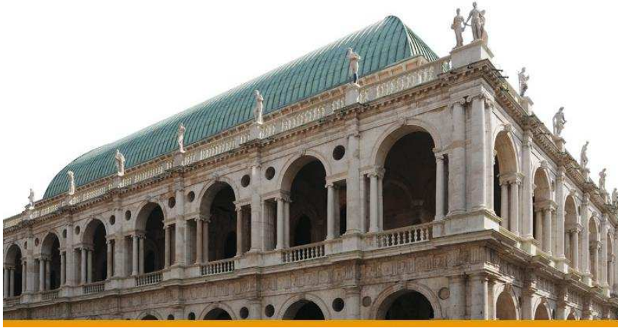
VICENZA -Basilica Palladiana